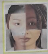
"Egalitatea este cel mai mare dușman al libertății." - Petre Țuțea