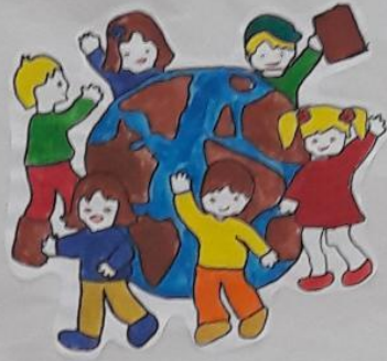
"Este loc sub soare pentru fiecare!"